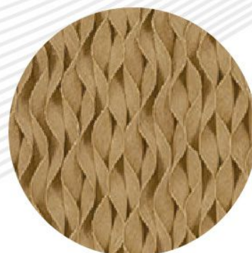
Подушка типа 5090