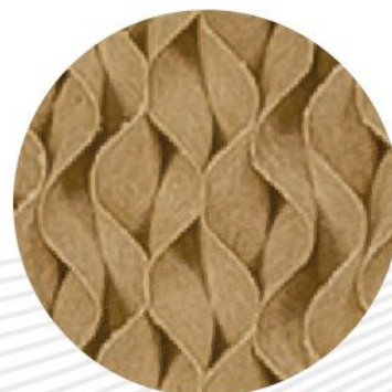
Подушка типа 7090

Охлаждающая подушка, которая является основной частью испарительного охлаждения, постоянно поддерживается влажной за счет циркуляции воды. С помощью вентилятора теплый и сухой воздух проходит через влажную подушку. Во время этого перехода происходит теплообмен между воздухом и водой. Прохладный и влажный воздух подается в помещение для его охлаждения.