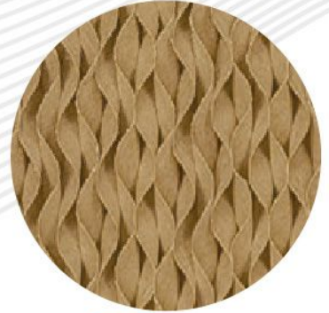
خلية تبريد 5090