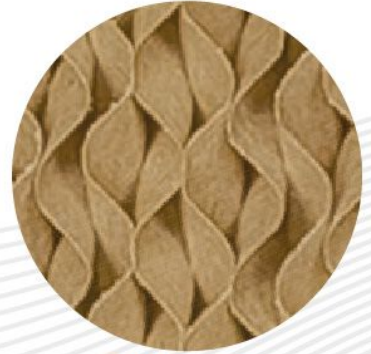
خلية تبريد 7090

خلية التبريد هي جزء أساسي من التبريد التبخيري. ويجب الحفاظ عليها باستمرار وهي رطبة من خلال توفير تدفق مستمر للماء من على سطحها. حيث يمر الهواء الساخن والجاف من خلال خلية التبريد الرطبة بواسطة مروحة. وبهذه العملية، يحدث تبادل حراري بين الهواء والماء، الأمر الذي يؤدي إلى توفير الهواء البارد والرطب في المكان المراد تبريده.